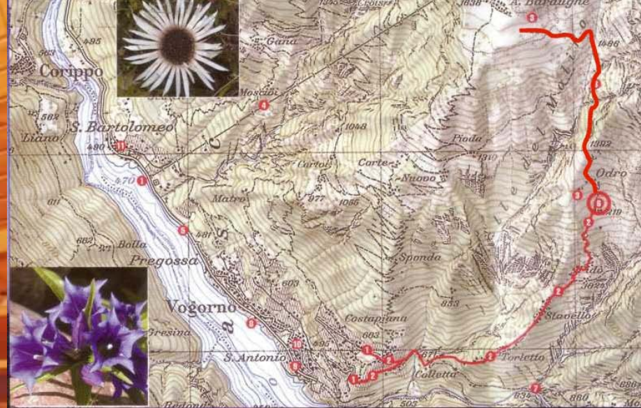
Riprodotta con l'autorizzazione di swisstopo Ref. 8A035307